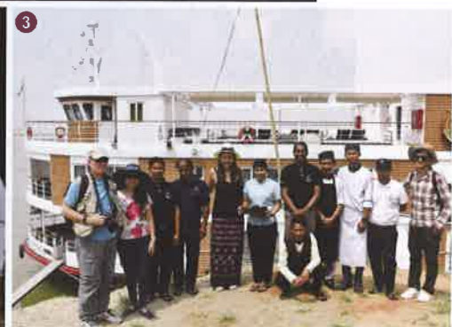
1 世界最大規模的古佛塔羣蒲甘。 2 元朝時期的佛塔保存了四千多座。 3 伊洛瓦底江上最新河船The Strand。