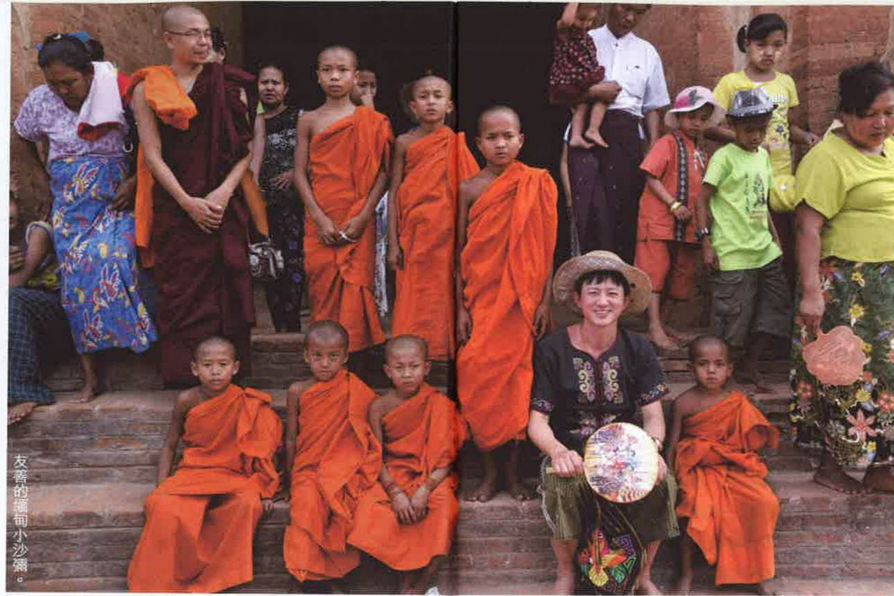
友善的緬甸小沙彌。

這家百年以來都以「蘇伊士運河以東最豪華酒店」著稱的殖民酒店，老風扇吹着歲月磨損的柚木地板，穿上 Longyi 的職員微笑着為我推行李，睡房裏花香撲鼻，連洗手間也插了新鮮薑花。Strand Hotel 剛剛今年開拓了 Strand