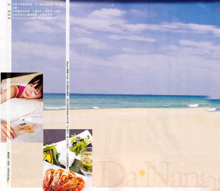
Roomier view from infinity pool - 私人會客室及浴室 - 私人泳池及按摩池 - 私人會客室及浴室 - 私人泳池及按摩池