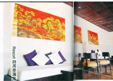
Resort 更位處鎮內唯一一個隱秘沙灘 Thuan An Beach 上

先說位置，它乃順化首家五星級海灘 resort，更位處鎮內唯一一個隱秘沙灘 Thuan An Beach 上，住客可以擁整個美羅沙灘不用像其他 resort 般爭前頭，曬太陽/ 談心/ 玩水/ 堆沙時碰口碰面都是熟悉的同胞，煞風景！雖自成一個，但距離鎮中心才不過 15 分鐘車程，更行街隨社購古物亦方便至極。