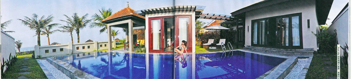
Resort 更位處鎮內唯一一個隱秘沙灘 Thuan An Beach 上